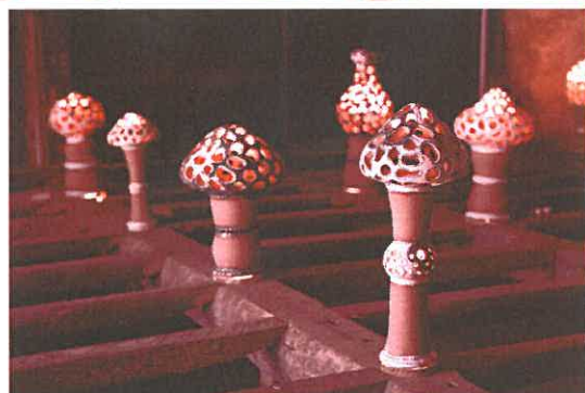
木精空間 AKIKO OKADA 2010